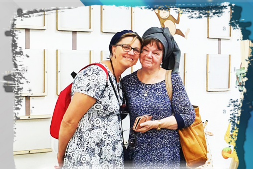
Vrijwilligster uit Nederland

Het Sabra-huis in Afoela dient als een brug en is een centrum voor: