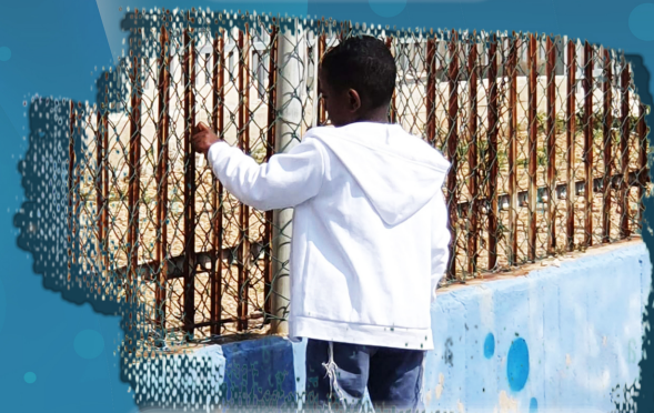
Hulp aan Weeskinderen