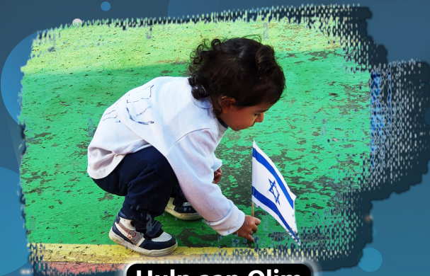
Hulp aan Olim