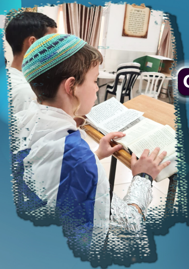
Onderwijs in de Joodse Wortels